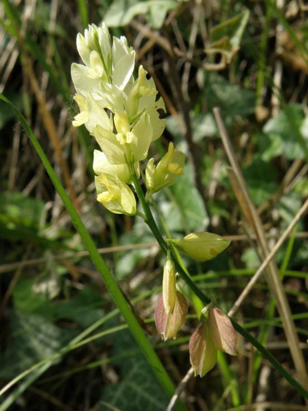
Polygala flavescens DC. subsp. pisauensis (Caldesi) Arcang.