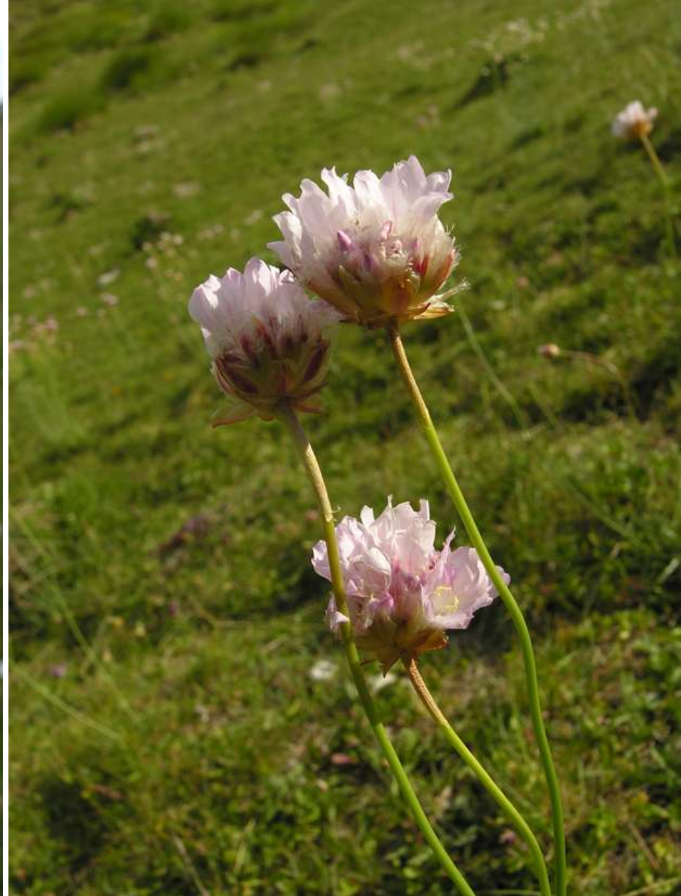
Armeria gracilis subsp. gracilis