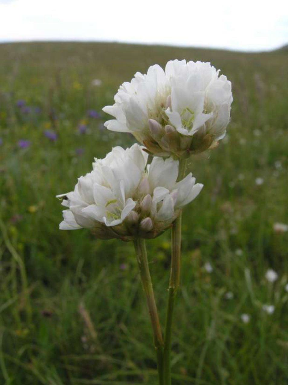
Armeria arenaria subsp. marginata